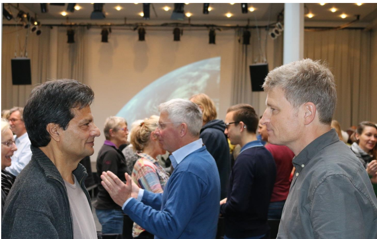
Deltagerne på konferencen laver dialogøvelser, faciliteret af Dialog Ambassadørerne